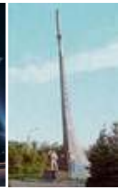
Landungs-Ort von Gagarin