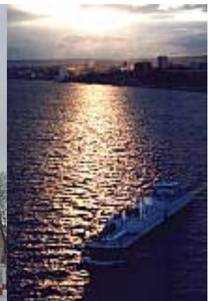
An der Wolga