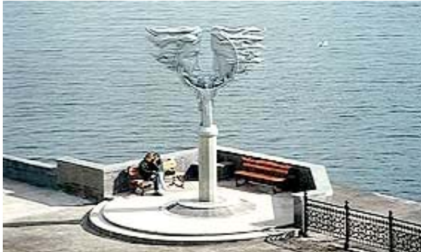
Säule der Liebenden am Kai